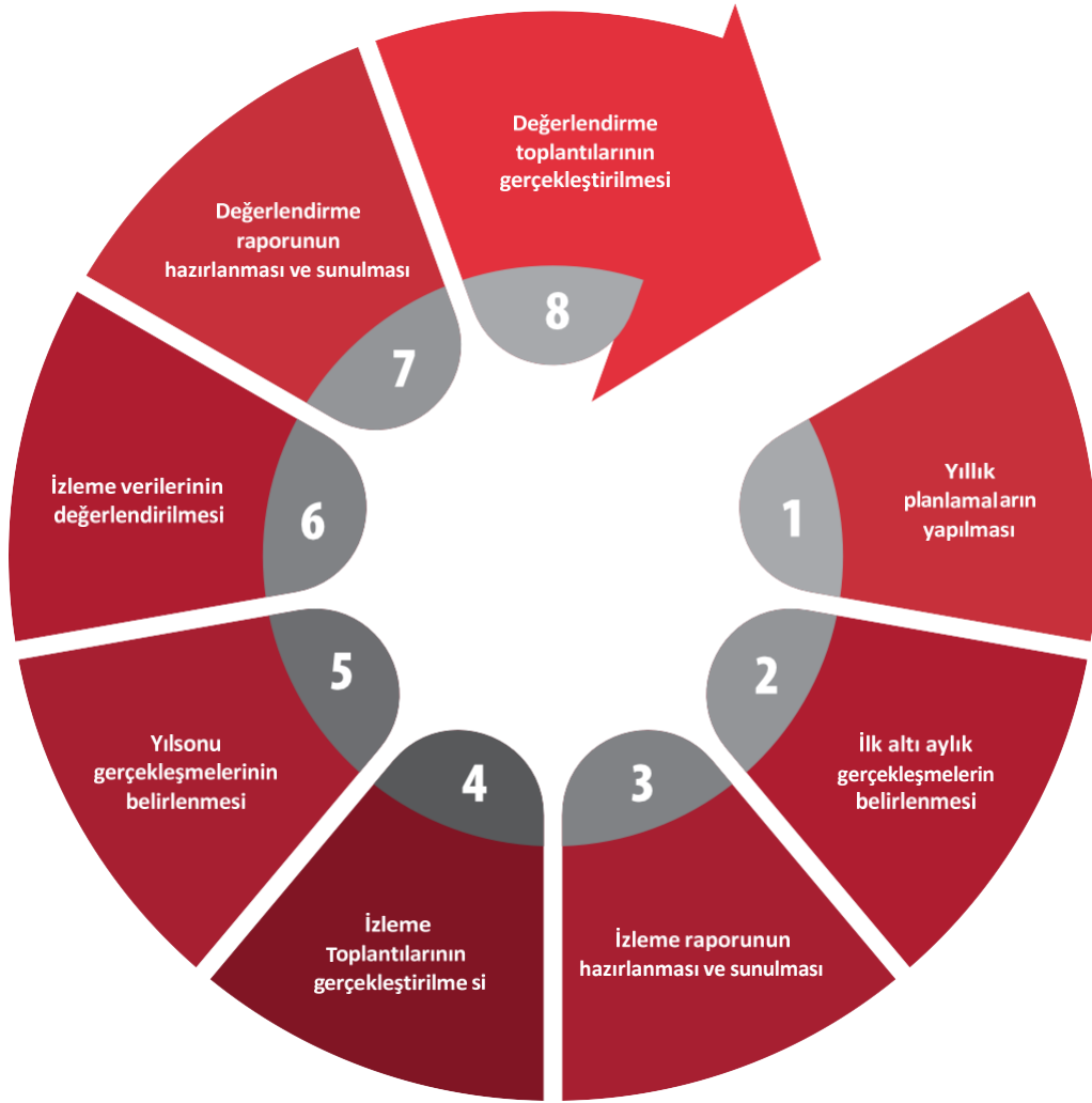
Şekil 1. İzleme ve Değerlendirme Süreci